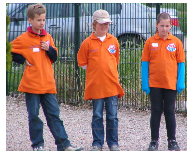
Oranje de kleur van de zone

toernooi zijn geweest. Laat het ons weten en wij plaatsen een leuk stukje. Uiteraard zijn foto's dan ook zeer welkom. Ook welkom zijn resultaten van toernooien, tenminste als je er zelf aan hebt meegedaan. Ook hier geldt dat een foto erbij hoort. Zone C, De meeste deelnemers aan de zonetraining komen uit Bergen op